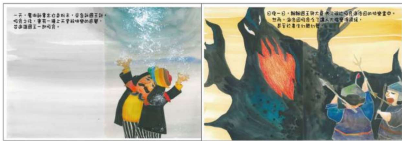
※範例作品：教育部反毒繪本—飄飄王國滅亡記/洪孟真、呂舒婷